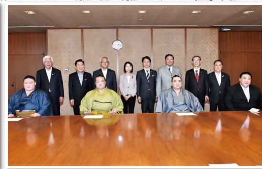
大相撲九州場所前に横綱と大関の表敬訪問を受けました。