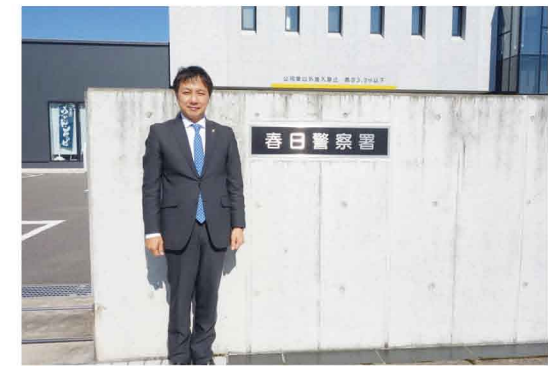
県内では一番新しい春日警察署を視察しました。

早良警察署から分割された新しい警察署がいよいよ2022年に私達の城南区に誕生する予定です。