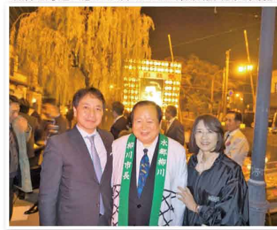
水郷の街、柳川市で開催された白秋祭に参加しました。