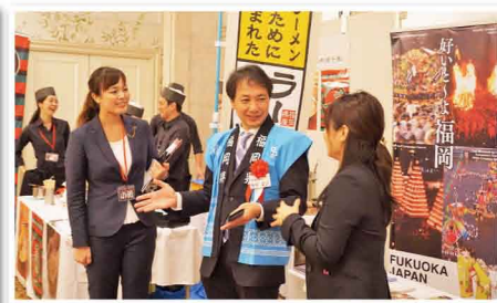
福岡県産品のトップセールスを大阪にて行いました。