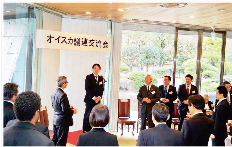
海外から農業研修などのために福岡県を訪れている皆さんに挨拶させて頂きました。