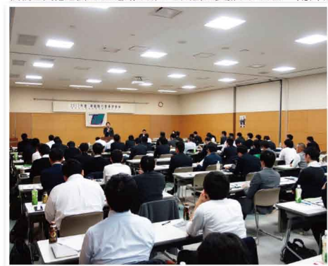
政治を身近に感じて頂くために県政報告会を実施しました。社会を明るくする運動「薬物乱用防止」を応援しています。