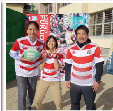
南片江校区で開催された「ラグビー教室」に参加しました。