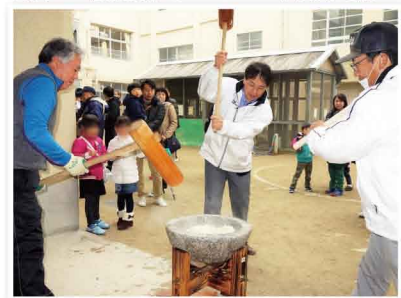
伝統と文化を伝える。地域の餅つき大会に参加しました。南片江校区の皆様と小川川事を訪問しました。