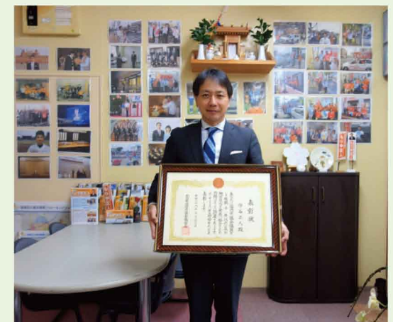
全国議長会から「自治功労」として表彰して頂きました。