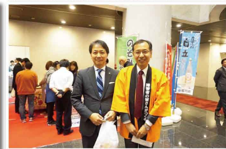
障がい者の方が作るまごころ製品を広める活動をしています。