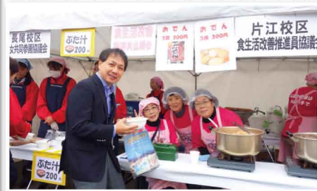
片江校区食生活改善推進員協議会の皆さんと共に。