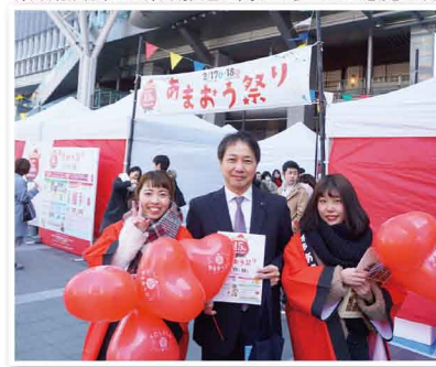
福岡県産いちごの「あまおう」の広報活動に参加しました。学生との勉強会で県の政策について議論しました。「イノシシ供養祭」で県の取り組み等を報告しました。