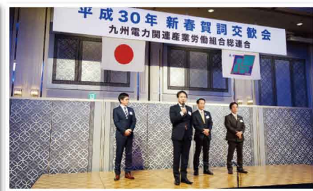
新春賀詞交歓会で県のエネルギー政策を交えてご挨拶しました。