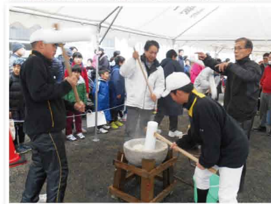
伝統と文化を継承する年始の餅つき大会に参加しました。将来を担う学生の皆さんと意見交換を行いました。