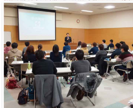
県政報告会では県政推進に関する多くのご意見を頂きました。連合福岡の新年交歓会で労働政策を交えてご挨拶しました。北九州市障害者スポーツセンターを訪問しました。