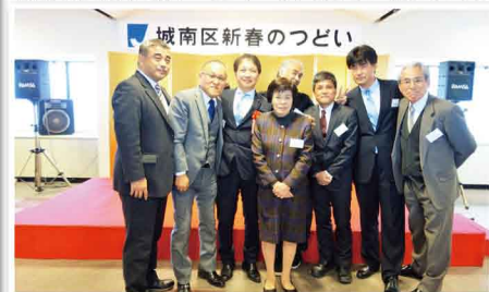
「城南区新春のつどい」に地元議員として参加しました。