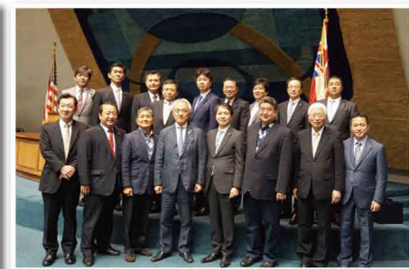
福岡県と友好交流のあるハワイ州と州議会を訪問しました。