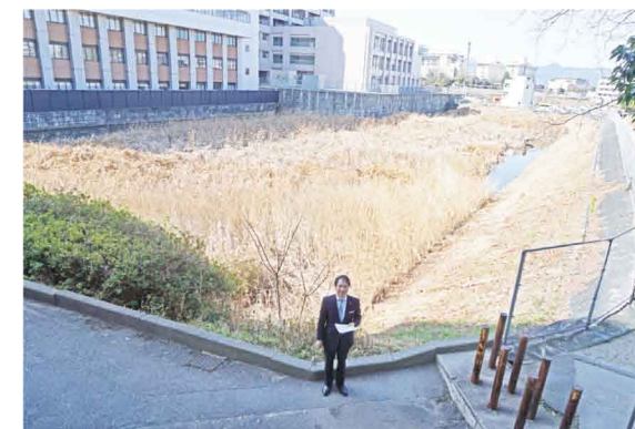
交換される福岡市所有の土地(烏帽子大池)