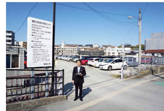
城南警察署の創設が予定される福岡大学の土地の一部