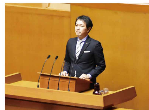
県民の声を県政に活かしていきます。