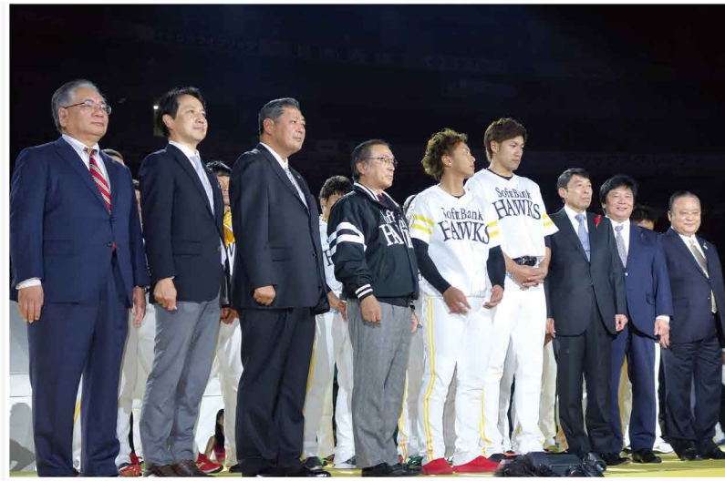
福岡ソフトバンクホークス日本一に対して県議会から感謝状を贈呈しました