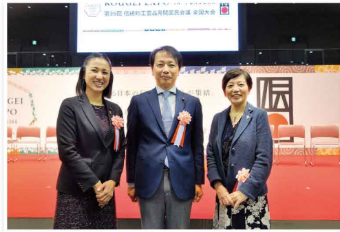
30年振りに福岡で開催された「KOUGEI EXPO」に参加しました