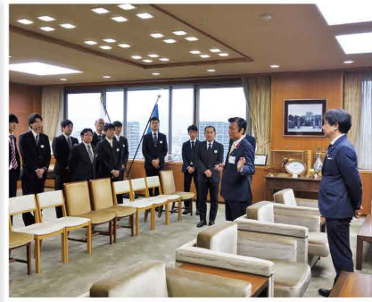
政治を身近に感じてもらう活動で知事執務室を訪問しました