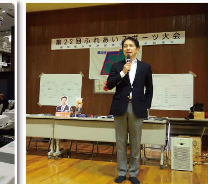
城南区内の体育館で開催されたスポーツイベントで挨拶しました