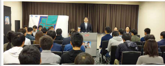
政治を身近に感じて頂くために議会報告を行いました