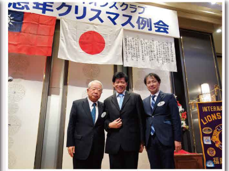
山崎広太郎福岡市長や陳台北駐日経済文化代表処長と共に