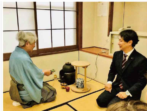
南片江の老人福祉センター寿楽園の文化祭を訪問しました 人生の先輩の皆様へ県政報告を行いました