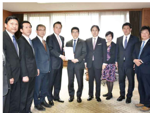
副議長時代も議員提案条例を成立させました

今後はパブリックコメント(意見公募)を実施し、2月定例県議会で議員提案条例として提案され、議決された後施行される見通しです。