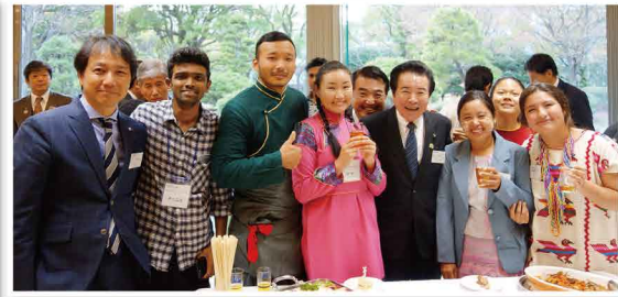
福岡に農業等を学びに来ているオイスカ実習生の皆様と共に