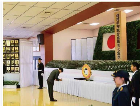
福岡県警殉職警察官慰霊式典に献花しました。