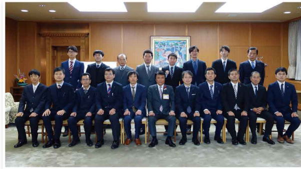
福岡県の小川知事を表敬訪問しました。