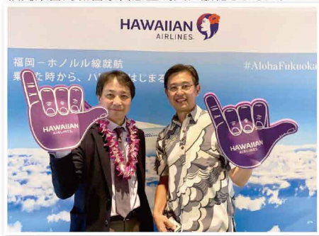
本県との交流のあるハワイ州との直行便が復活しました。政治を身近に感じて頂く活動「県政報告会」を実施。