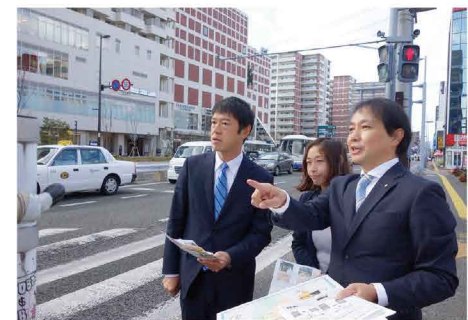
渋滞解消対策を国に陳情しました。