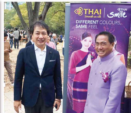
アッターカーン在福岡タイ王国総領事と共に。