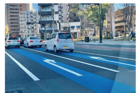
朝夕の交通渋滞が緩和されます。