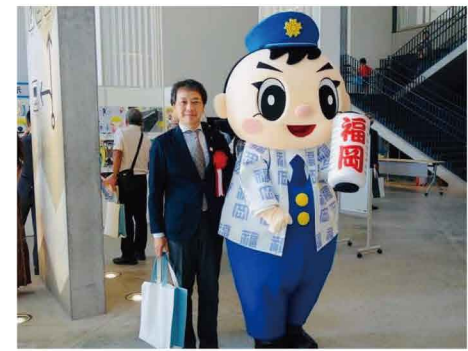
「安全安心まちづくり県民の集い」に参加しました。