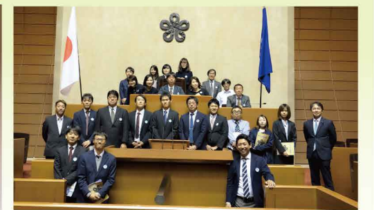
多くの皆さんの声を今年も政治に結び付けて参ります。