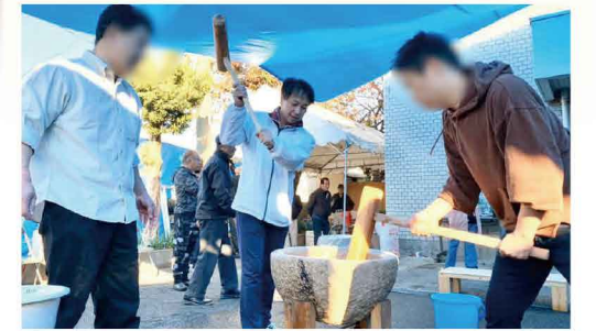
地域の安全と安心の願いを込めて餅をつきました。