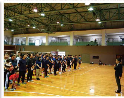
城南区で開催されたソフトバレー大会で来賓挨拶しました。