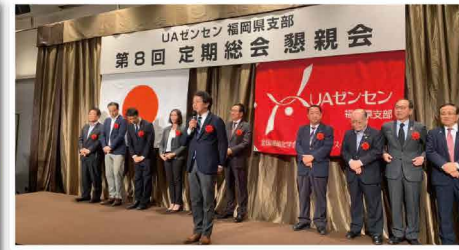
ご推薦頂いた団体の定期総会で来賓挨拶しました。