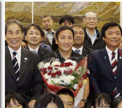
ラグビーワールドカップで活躍した久留米市出身の流選手と共に。