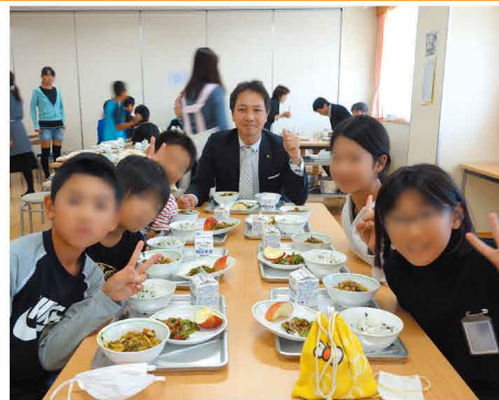
子供達の健康と未来を守っていきます。

医療費助成を中学3年生まで拡大する事で市町村の格差是正(公平な住民サービス)と保護者等の負担軽減が行われます。