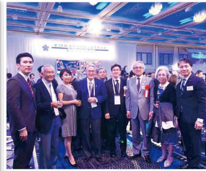
全世界福岡県人会に参加しました。