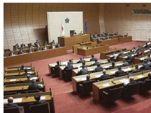
令和元年12月県議会が閉会しました。

条例では福岡市の中洲地区で増加している風俗案内所の過度の広告の規制を強化する条例の改正案等合わせて17議案が提案され、予算案2件等合わせて28件が審議されました。最終日に採決が行われ、賛成多数で可決されました。