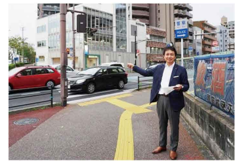
中村学園前交差点の安全対策に取り組んで行きます。