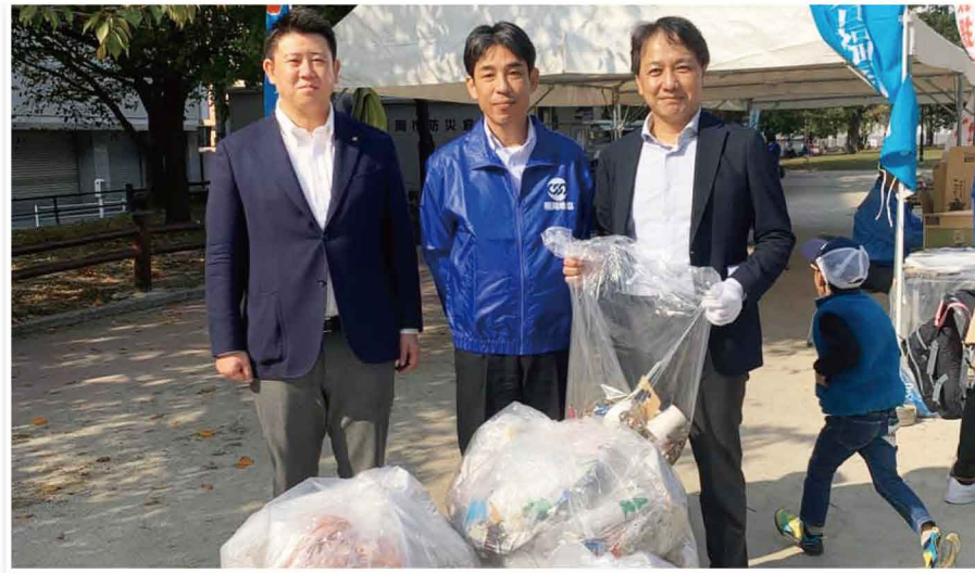
連合福岡地協主催のまちなか清掃活動に参加しました。