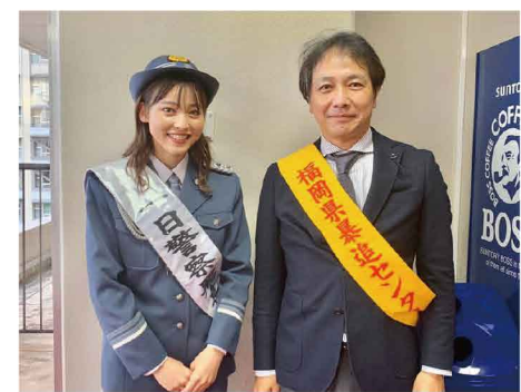
「早良警察署暴力団追放大会」に参加しました。