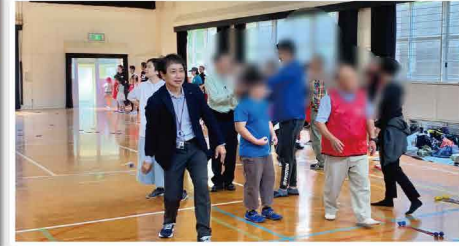
「片江・南片江2校区スポーツ交流会」に参加しました。