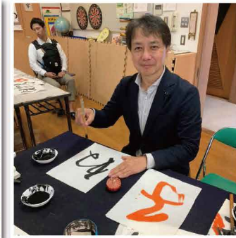
公民館サークル発表会で来年の干支を書きました。